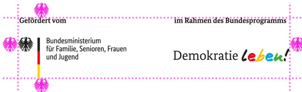
Illustration: Schutzraum um das Logo